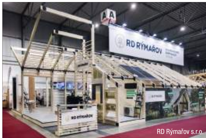
RD Rýmařov s.r.o.