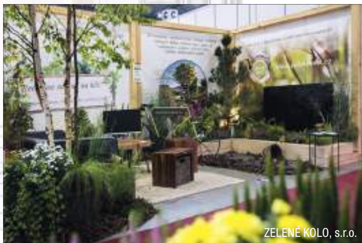
ZELENÉ KOLO, s.r.o.