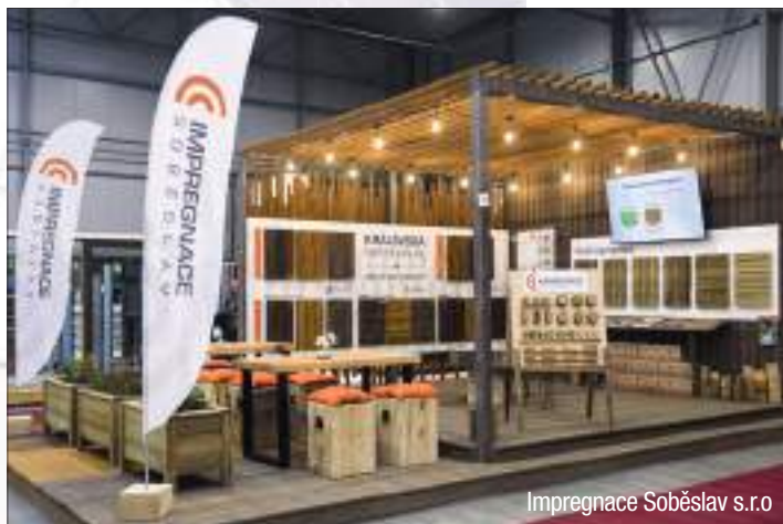
Impregnace Soběslav s.r.o.

Schlieger, s.r.o., Hala 4 – č. stánku 4B14